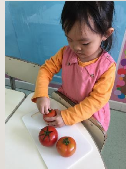
香港鑪峯獅子會 幼兒園