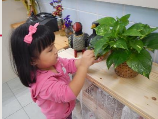
南九龍獅子會幼兒園